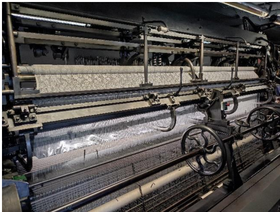
Métier à tisser Dentelle de Calais Cité dentelle mode Calais

En s'attachant au thème de la transparence, cette collaboration inédite des deux musées permet de révéler combien le couturier a su renverser les codes du dévoilement du corps féminin. A travers une soixantaine de modèles issus des collections de la Fondation Pierre Bergé - Yves Saint Laurent et de la Cité de la dentelle et de la mode, complétés d'accessoires, de dessins, de photographies et de vidéos, l'exposition démontre la manière dont Yves Saint Laurent a su utiliser les effets de transparence des tissus pour proposer une figure de femme nouvelle, puissante et sensuelle.